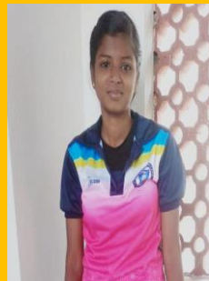
V. NAGOORAL II B.A HISTORY (EM) KABADI , ATHLATIC FOOTBALL