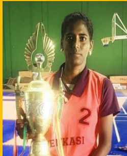
M. SARANYA II BA HISTORY (TM) KHO-KHO, ATHLATIC