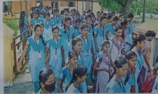
பாளையில் உள்ள வரலாற்று சிறப்புமிக்க மேற்கு கோட்டை வாசல் கட்டிடத்தை ராணி அண்ணா அரசு கல்லூரி மாணவிகள் சுற்றி பார்த்தனர்.

நெல்லை : PSS மல்டிபிளக்ஸ் A/c, ராம் / முத்துராம் சினிமா தூத்துக்குடி: ஸ்ரீபாலகிருஷ்ணா, பெரிசன் பிளாசா | நாகர்கோவில் : ஸ்ரீகார்த்திகை, ராஜே தென்காசி: PSS மல்டிபிளக்ஸ் | அம்பை: பாலாஜி ஆலங்குளம் : TPV மல்டிபிளக்ஸ் | சந்திரமங்கலம்: லெட்சுமி | திருச்செந்தூர்: ஸ்ரீகிருஷ்ணா | ஆறுமுகனேரி: தங்கம் | குழித்துறை: லெட்சுமி | கரண்டை: நடராஜ் | மார்த்தாண்டம்: ஆனந்தா