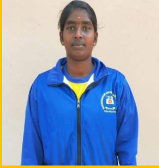
G.ARICHANDRATAMILSELVI II.M.A HISTORY KABADI AND ATHLATIC (FROM-3)